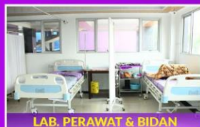
LAB. PERAWAT & BIDAN