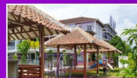
GAZEBO & TAMAN BERMAIN