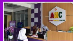
AISYAH MEDICAL CENTER