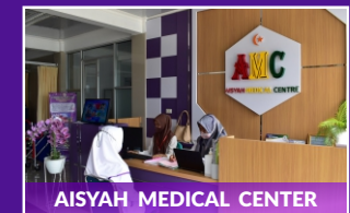
AISYAH MEDICAL CENTER