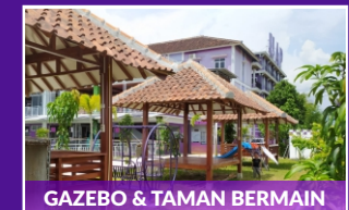
GAZEBO & TAMAN BERMAIN